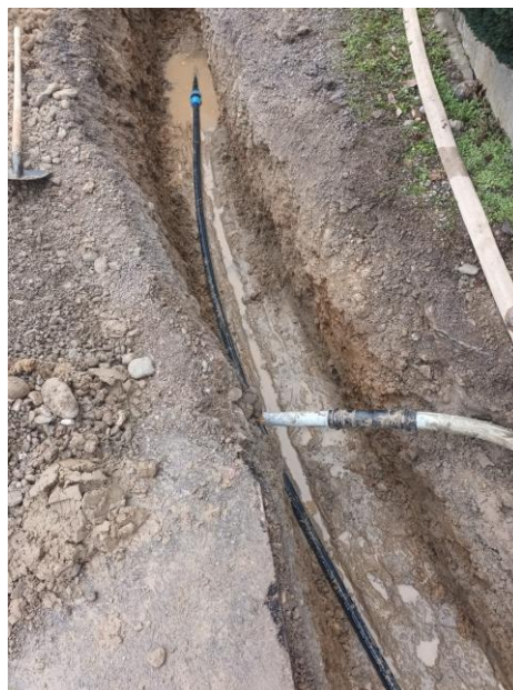
Rohrbruch Rotzenwil (Foto)

Im letzten Jahr hatten wir lediglich einen Rohrbruch und eine Leitung wurde bei den Bauarbeiten erwischt. Ansonsten hatten wir keine grösseren Rohrbrüche zu beheben, was uns sehr freut. Es ist für die WKM enorm wichtig, den Unterhalt des gesamten Netzes sowie der Pumpwerke und Anlagen fortlaufend zu gewährleisten.