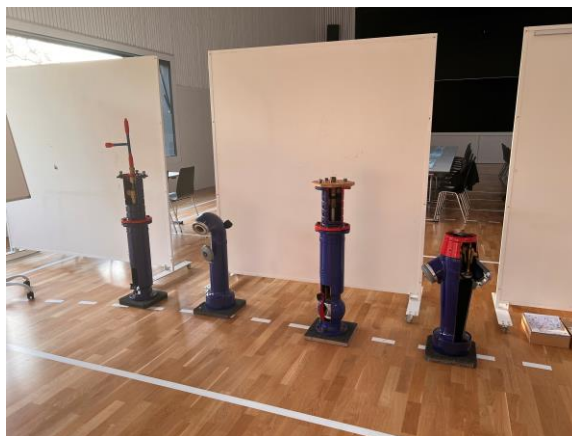
Tag der offenen Tür (13. Mai 2023)

Die WKM durfte im Mai ihren Tag der offenen Tür durchführen. Das grosse Interesse und zahlreiche Erscheinen der Bürgerschaft haben uns sehr gefreut. Wir dürfen auf einen sehr gelungenen und interessanten Tag zurückblicken.